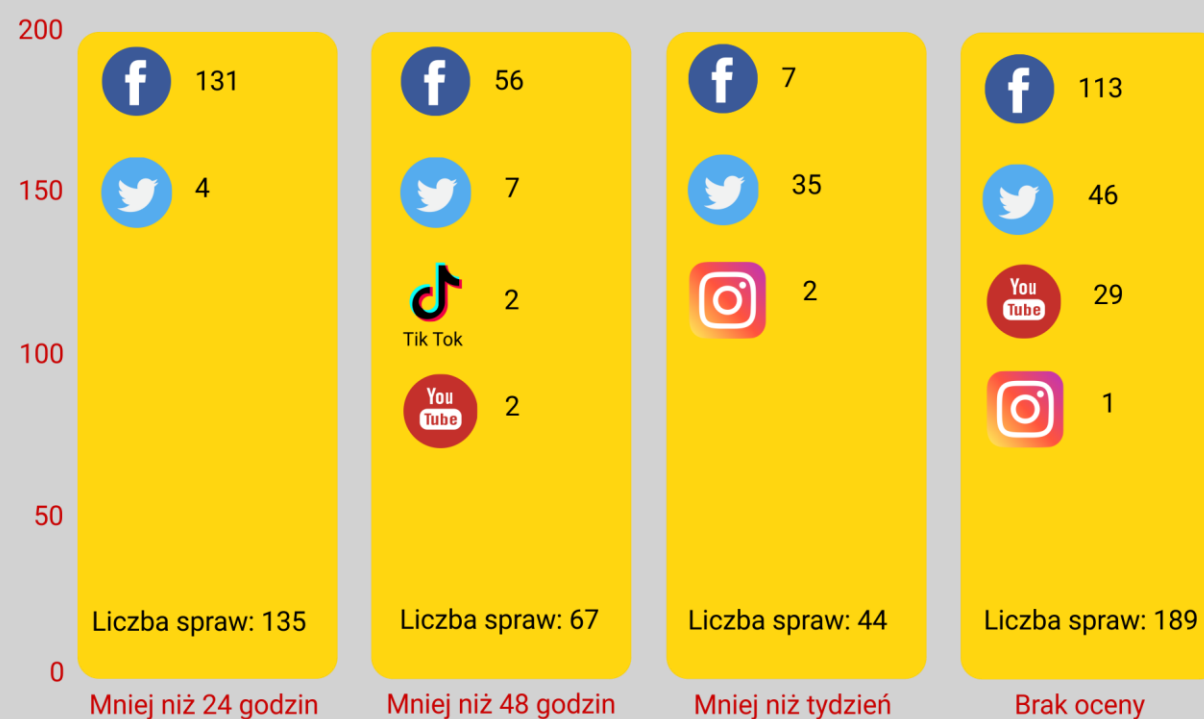
Responsywność platform społecznościowych

Prawie 90% potencjalnie nielegalnych i obraźliwych treści zidentyfikowano na Facebooku (307 przypadków), z czego platforma potrafiła przeanalizować większość zgłoszonych treści w przeciągu od 24 godzin do jednego tygodnia w przypadku 64% zidentyfikowanych treści. Ocena postępowania Facebooka spadła w porównaniu z poprzednim ćwiczeniem monitoringu, ale to należy rozpatrywać w kontekście pandemii COVID-19, kiedy to platforma społecznościowa przeznaczyła większość swoich zasobów na inne wrażliwe obszary, jak np. rozpowszechnianie przez użytkowników fake newsy czy zachowania wprowadzające w błąd w czasie kryzysu COVID-19.