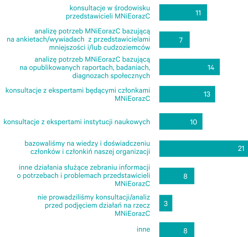
Wykres 38. Działania podejmowane na etapie planowania lub przed rozpoczęciem działań na rzecz MNiEorazC. Badanie organizacji działających na rzecz mniejszości narodowych i etnicznych i/lub cudzoziemców

członkami, na etapie planowania powinno się wymagać badań, które pozwolą spojrzeć z perspektywy grupy, w naszym przypadku, mniejszościowej. Respondenci wskazali, iż na etapie planowania najczęściej (21) korzystają z wiedzy i doświadczenia członków i członkiń swojej organizacji , drugim najczęściej (14) wskazanym działaniem jest analiza potrzeb MNiEorazC bazująca na opublikowanych raportach, badaniach, diagnozach społecznych .