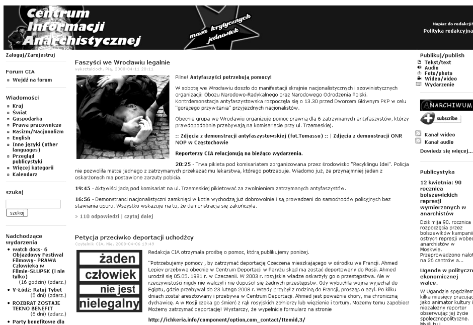
Rys. 2. Strona główna Centrum Informacji Anarchistycznej.

lub informacji o wydarzeniach. Dodatkowo do wyboru pozostają działy tematyczne, m.in. Gospodarka, Prawa pracownicze, Rasizm/Nacjonalizm itp. Dla osób pragnących pozostać w ciągłym kontakcie z serwisem oferuje się możliwość subskrybowania kanałów RSS.