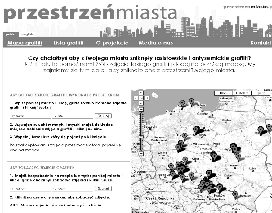
Rys. 4. Witryna akcji „Przestrzeń miasta”.

coraz szersze kręgi, bowiem w marcu 2008 r. współpracę z wrocławskim Młodym Centrum nad łódzką edycją projektu podjął Instytut Tolerancji w Łodzi 18 .