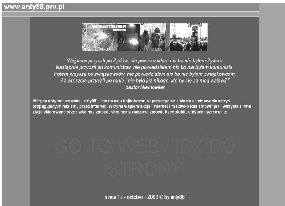
Rys. 4. Witryna antynazistowska „Anty88”.

Z godną zainteresowania inicjatywą w zakresie walki z przejawami nienawiści rasowej wyszło Stowarzyszenie Młody Wrocław, które wraz ze Stowarzyszeniem Młode Centrum i Młodzieżowym Klubem Żydowskim „KEN” powołało do życia specjalny serwis internetowy pod nazwą „Przestrzeń miasta” 16 . Ma on za zadanie zwracać uwagę i uwrażliwiać społeczeństwo na elementy pojawiające się w naszym otoczeniu, przekazujące obraźliwe i nietolerancyjne treści, pod postacią rysunków, graffiti czy plakatów, umieszczanych na ścianach budynków, przystankach środków komunikacji oraz słupach ogłoszeniowych w całej Polsce. Główną częścią serwisu jest lokalizator, umożliwiający dotarcie do zdjęć, zamieszczonych wcześniej przez osoby współtworzące bazę miejsc, w których stwierdzono obecność wspomnianych treści. Organizatorzy zaznaczają wyraźnie, że akcja nie ma na celu inicjowania kolejnych dni „Kolorowej Tolerancji” 17 , odbywających się w kilku polskich miastach. Informacje o zdjęciach przekazywane są policji lub straży miejskiej, która następnie ma obowiązek wyegzekwowania od administratorów budynków usunięcia obraźliwych treści.