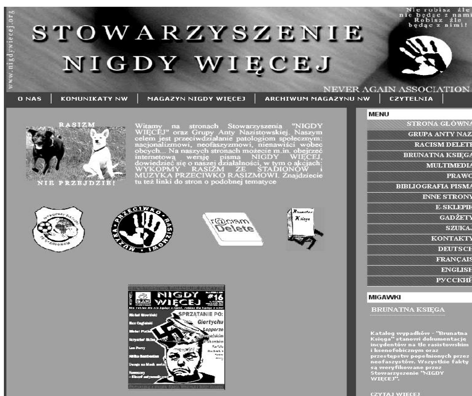
Rys. 1. Strona główna witryny internetowej stowarzyszenia „Nigdy Więcej”.

międzynarodową, której efekty są realizowane w licznych programach partnerskich i wspólnych akcjach prowadzonych na terenie Polski i Europy. Na początku lutego 2008 r. stronę nieco przebudowano, zmianie uległa szata graficzna oraz dodano nowy dział: „Czytelnia”, w którym można znaleźć teksty poświęcone zagadnieniom antyrasistowskim i antyneofaszystowskim. Zmodyfikowano i powiększono istniejące już działy, np. Multimedia, gdzie obok video pojawiły się pliki w formacie mp3, zaktualizowana o rok 2007 została także „Brunatna Księga”.