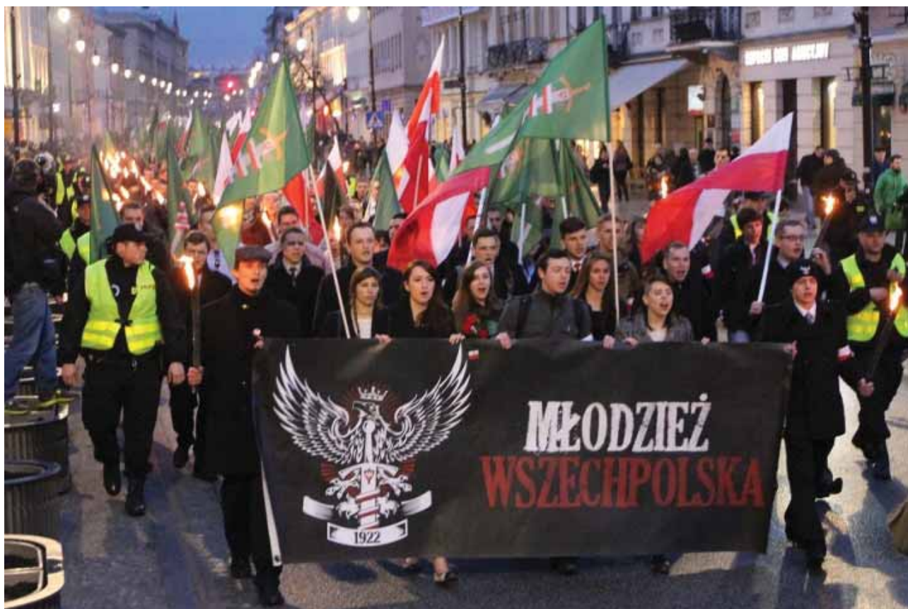
Marsz Młodzieży Wszechpolskiej w 2013 roku.

(...) Kiedyś wszystko było jasne. Faszysta miał zakazaną gębę, wygolony łeb, wypucowane glany i czerwone szelki. Bił ludzi na koncertach, bo nie podobał mu się ich wygląd lub poglądy. Jak chciał być elegancki, to wkładał brunatny mundur, unosił rękę w górę i wykrzykiwał coś o białej sile, o czarnuchach i Żydach , których należy przepędzić z Polski. Nazi-skin to był typ spod budki z piwem, którego nikt nie traktował poważnie. Margines bez żadnego politycznego znaczenia. Wszystko zmieniło się pod koniec lat 90. Młodzież Wszechpolska stawała się na radykalnej prawicy potęgą i ściągała pod swoje skrzydła młodych narodowców. Kilku trafiło nawet do Sejmu.