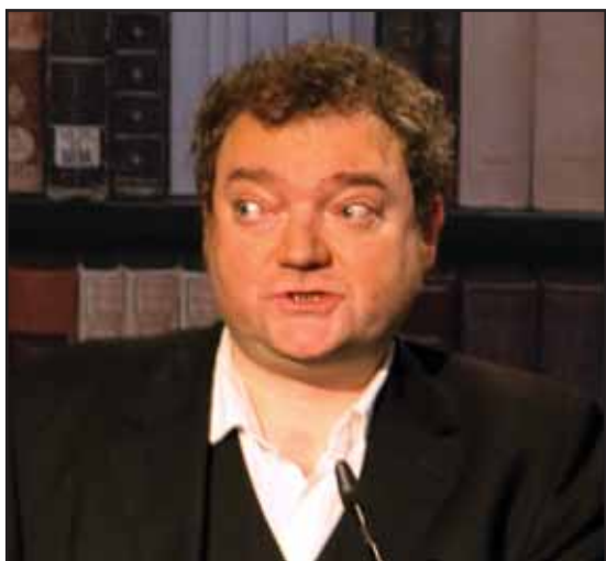
Wiglaf Droste

Niemiecki satyryk Wiglaf Droste w swoim tekście z lat 90-tych pod tytułem Rozmawiać z nazistami napisał prowokacyjnie: