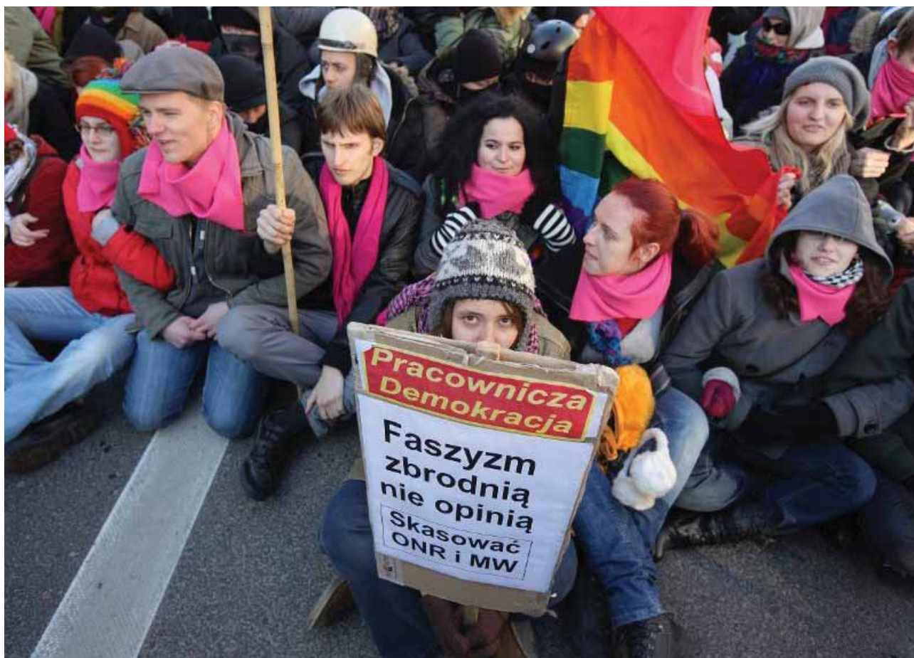
Uczestnicy wiecu Kolorowa Niepodległa 11.11.2011 r.

W roku 2011 roku powstało Stowarzyszenie Marsz Niepodległości – oficjalny organizator Marszu, skupiające działaczy tych organizacji. Według organizatora w Marszu 2011 poszło 20 tysięcy osób. Skrzyknęli się także przeciwnicy narodowców. Powstałe dwa lata wcześniej luźne Porozumienie 11. Listopada zorganizowało wiec Kolorowa Niepodległa z zamiarem zablokowania Marszu Niepodległości.