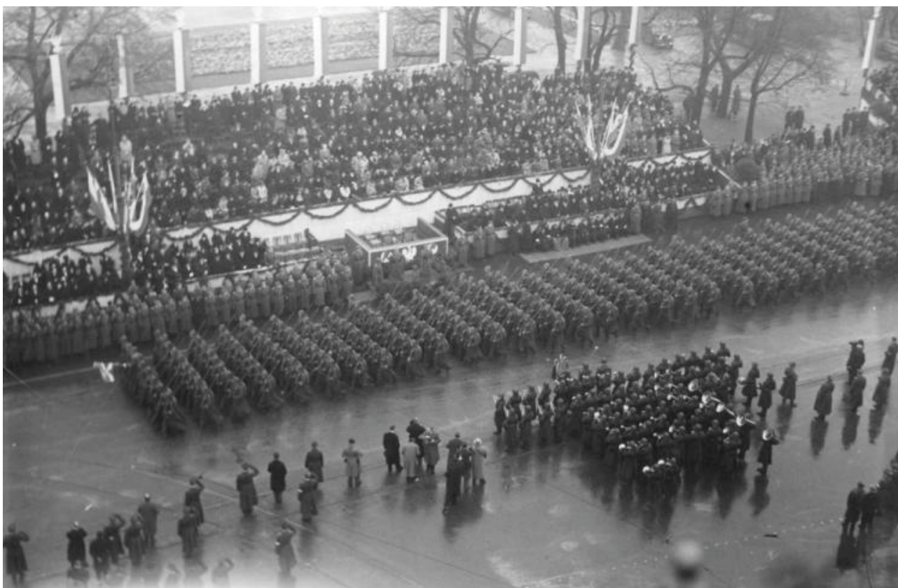
Obchody Święta Niepodległości w Warszawie 11.11.1937.

O wyborze daty zdecydowały przede wszystkim dwa istotne wydarzenia, mianowicie (1) zawarcie rozejmu w Compiègne 11 listopada 1918, pieczętującego ostateczną klęskę Niemiec w I Wojnie Światowej; oraz przekazanie przez Radę Regencyjną władzy nad wojskiem przybyłemu dzień wcześniej do Warszawy, brygadierowi Piłsudskiemu.