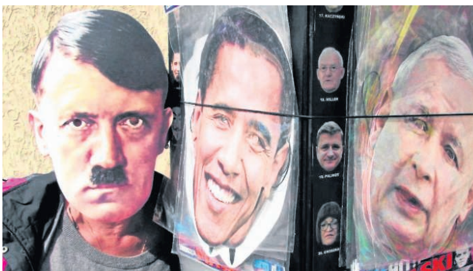
► Firma Powergift z Bytowa produkowała maski nie tylko z wizerunkiem Adolfa Hitlera. Wielkim powodzeniem cieszyły się wśród kupujących także maski polskich polityków i celebrytów

Jego zdaniem, handel tego typu przedmiotem można oceniać negatywnie jedynie z etycznego punktu widzenia. Odpowiedzialność karną mogą ponieść natomiast tylko takie osoby, które się dopuszczają propagowania z zamiarem