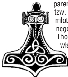
Młot Thora-Mjollnir „rasy aryjskiej”.

parencie znajdował się również tzw. Mjollnir (staroskandynawski młot Thora) – atrybut mitologicznego boga skandynawskiego, Thora. Współcześnie jest on zawłaszczany przez neonazistów i, szczególnie, rasistów praktykujących odynizm – religię neopogańską, dla której oznacza siłę i czystość